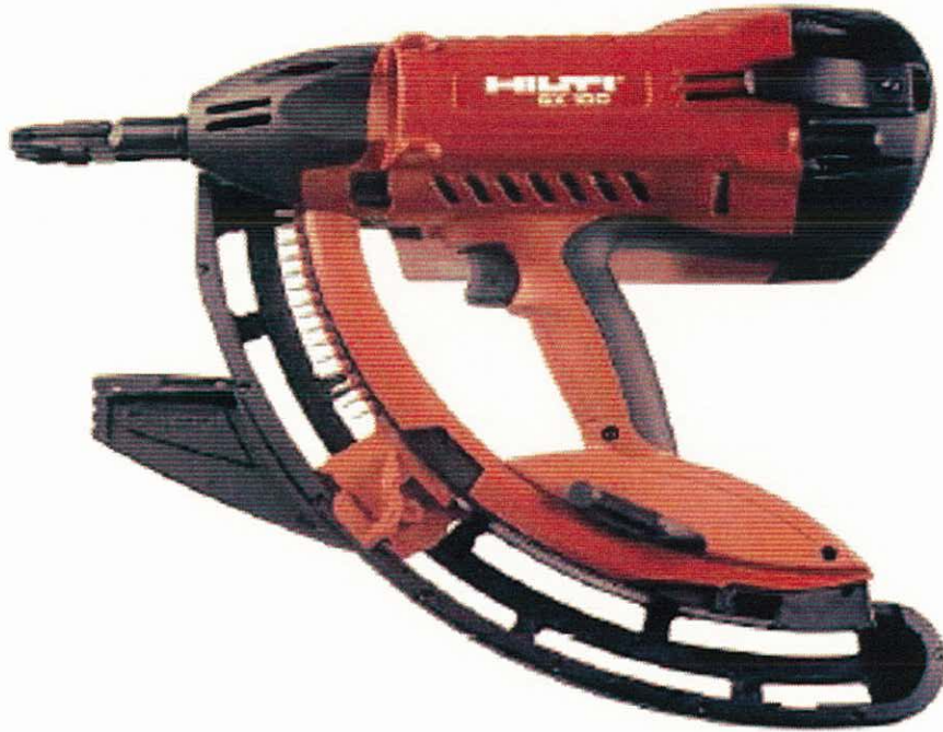
Nagelgerät Hilti GX-120